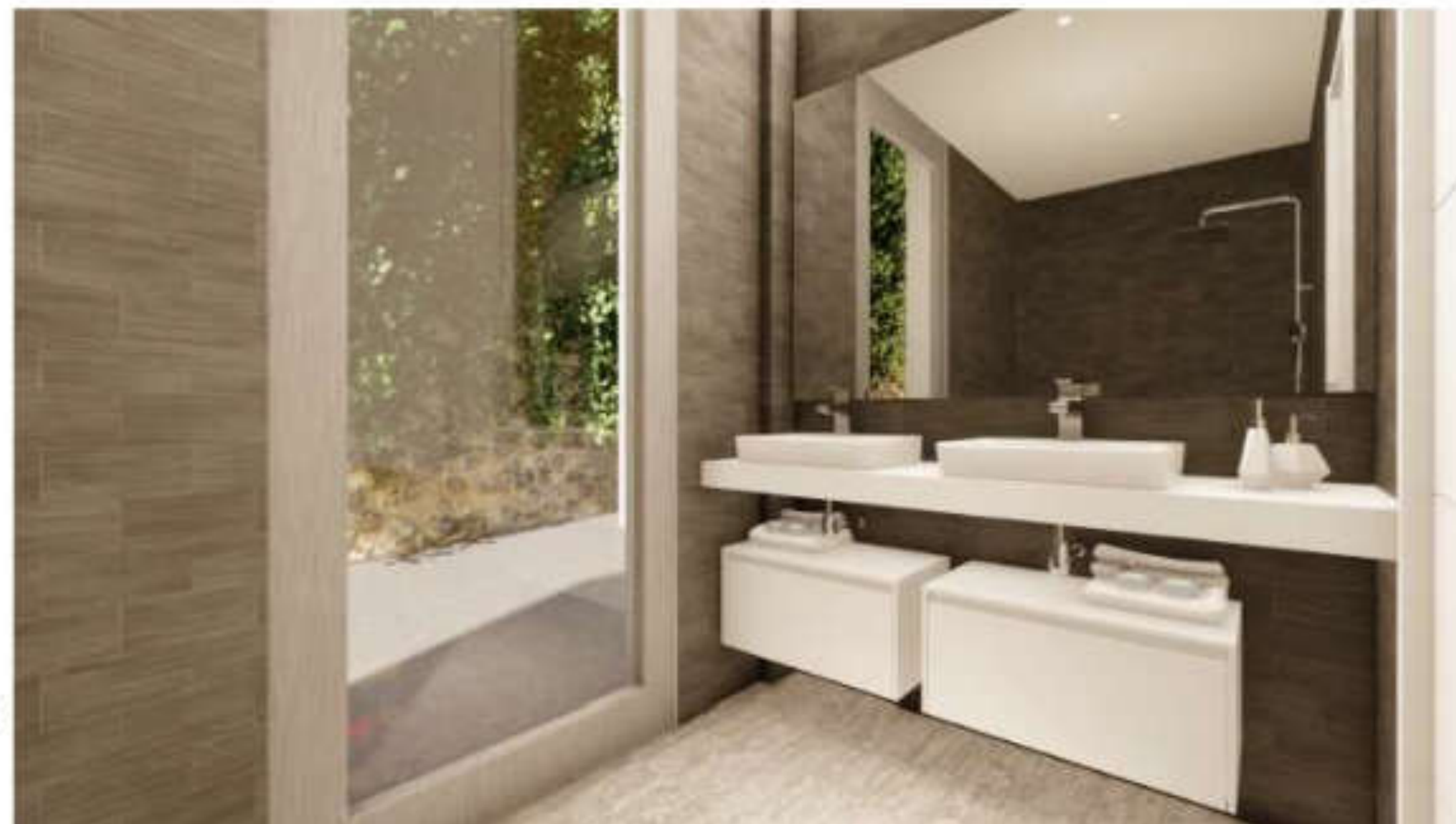
Baños amplios y con ventilación