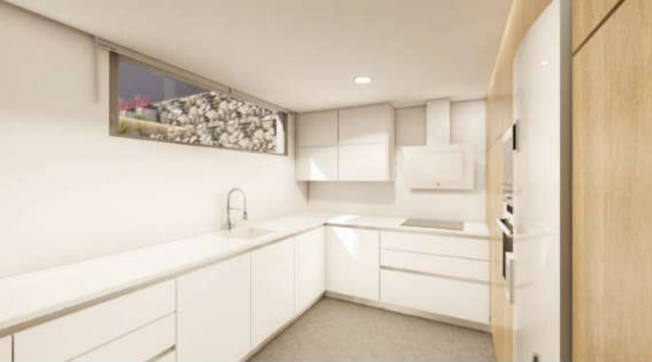
Cocina equipada de alta calidad