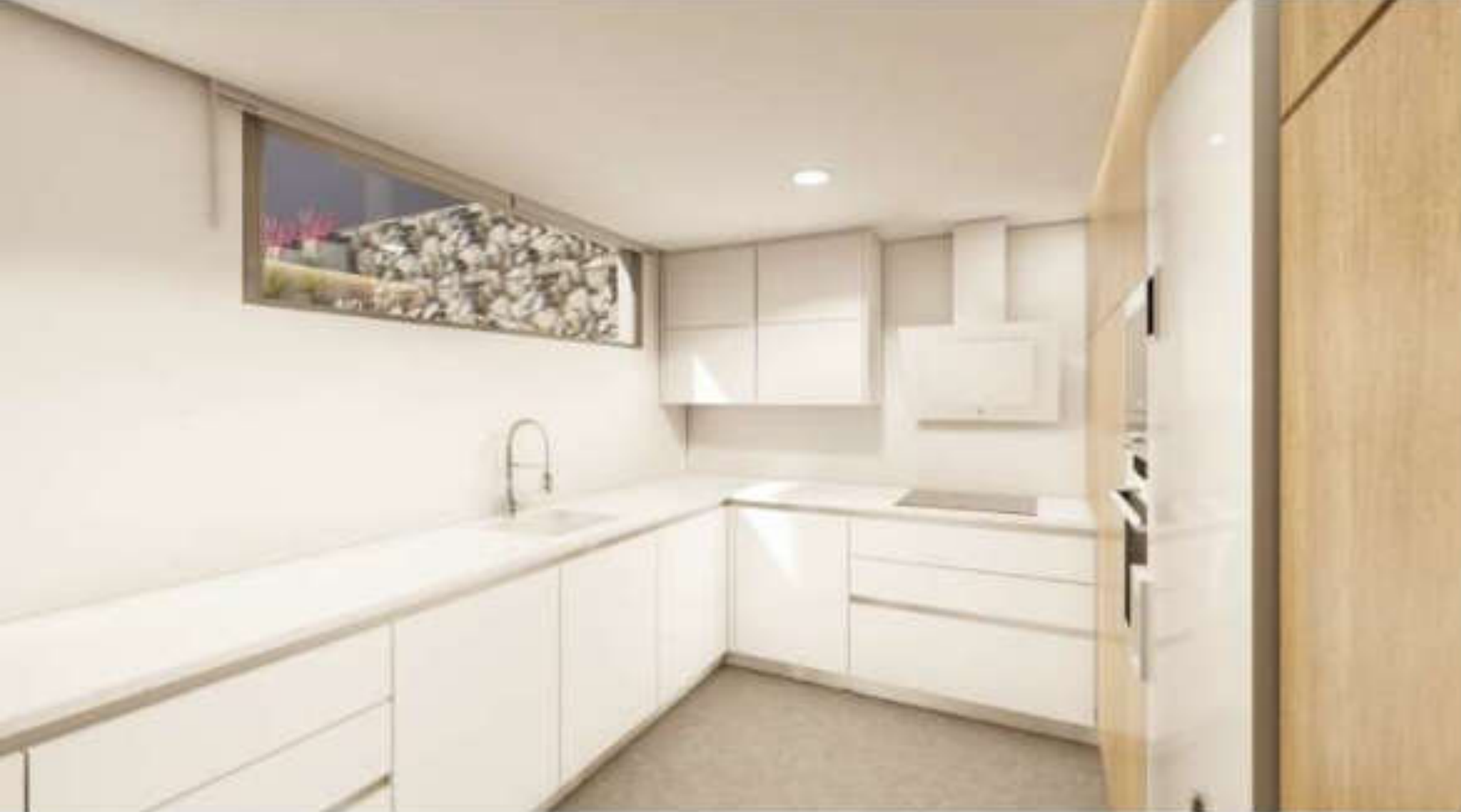
Cocina equipada de alta calidad