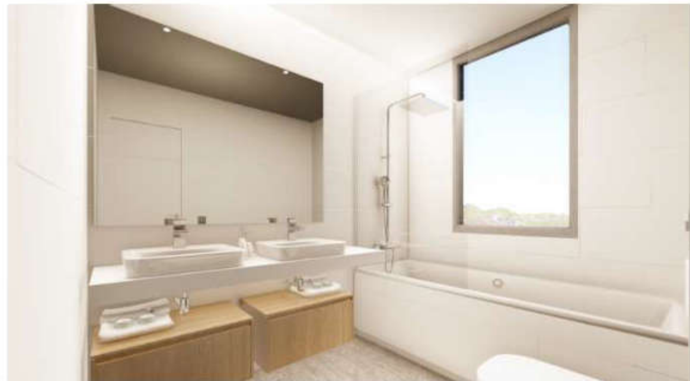
Baños amplios y con ventilación